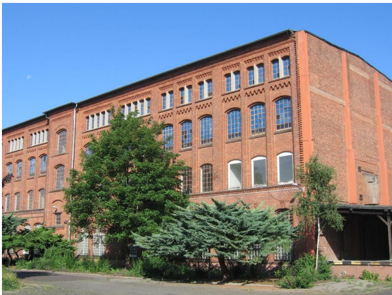
Ehemaliges Montagehaus Orberstraße 4a im Jahr 2008

Die erste Maschinenfabrik der Firma Mayfarth an der Hanauer Landstraße konnte nach einem verheerenden Brand im Jahr 1892 zwar wieder aufgebaut und durch Zukauf von weiteren 13.000 qm Gelände von der Hessischen Ludwigsbahn im Juni 1895 noch einmal erweitert werden, aber eine Ende der Steigerung der Produktion durch die räumliche Enge war absehbar. Ein unter kluger Voraussicht im Jahr 1903 erworbenes über 100.000 qm großes Grundstück im neu geschaffenen