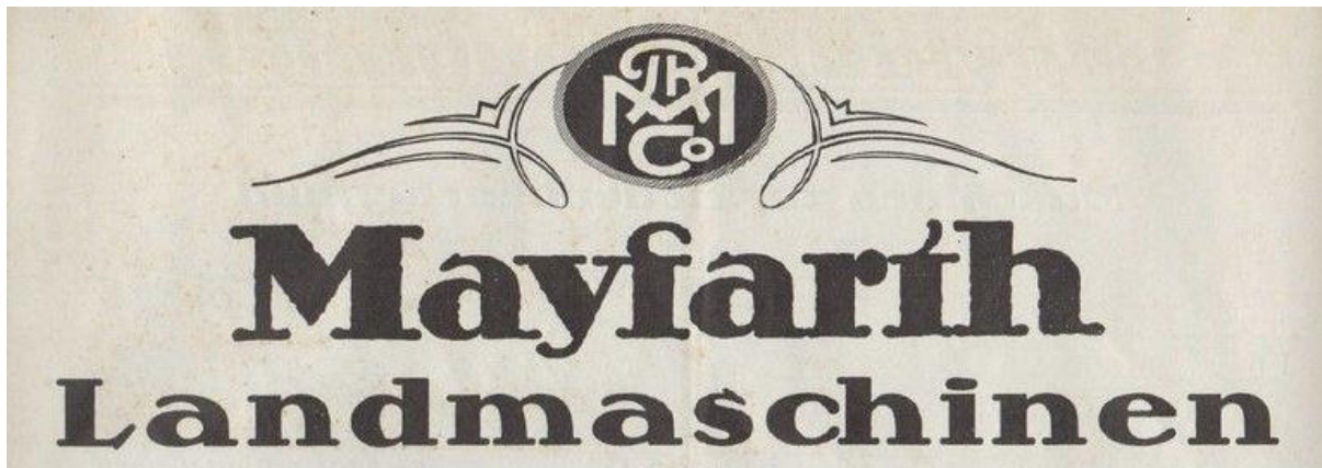
Firmenlogo von Ph. Mayfarth & Co.