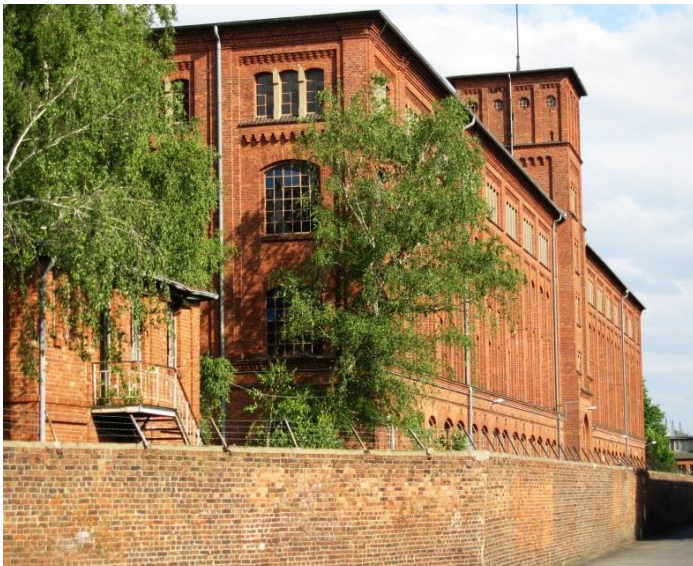
Gebäude Wächtersbacher Straße im Jahr 2005, Foto: Ulf Ludßuweit

Neu in der Stadt, führte mich nicht nur die Wohnungssuche auch in die weiteren Stadtteile und Vororte von Frankfurt. Schon immer an Geschichte interessiert, machte ich mich auf die Spuren der ehemaligen Computerfirma Tandon, die in der Wächtersbacher Straße 59-61 in Fechenheim ihre