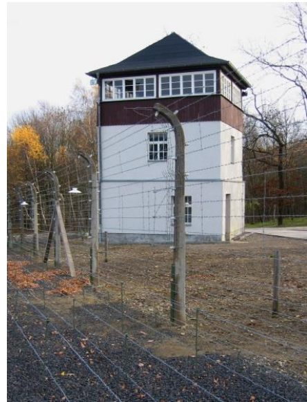
Wachturm KZ Gedenkstätte Buchenwald im November 2008